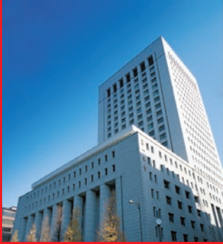
Tòa nhà trụ sở Dai-ichi Life Holdings tại Tokyo, Nhật Bản